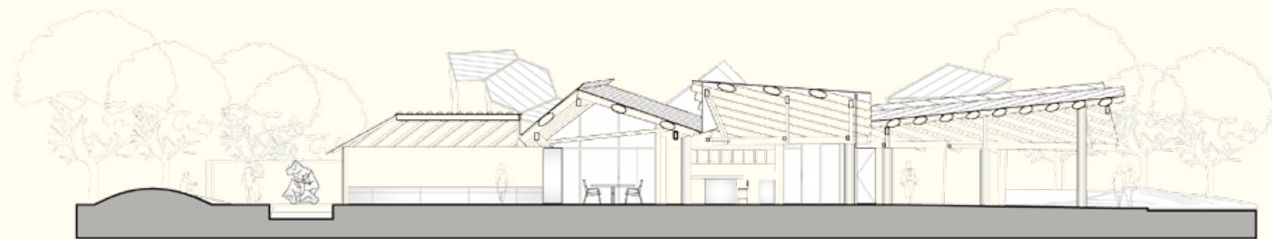
剖面圖